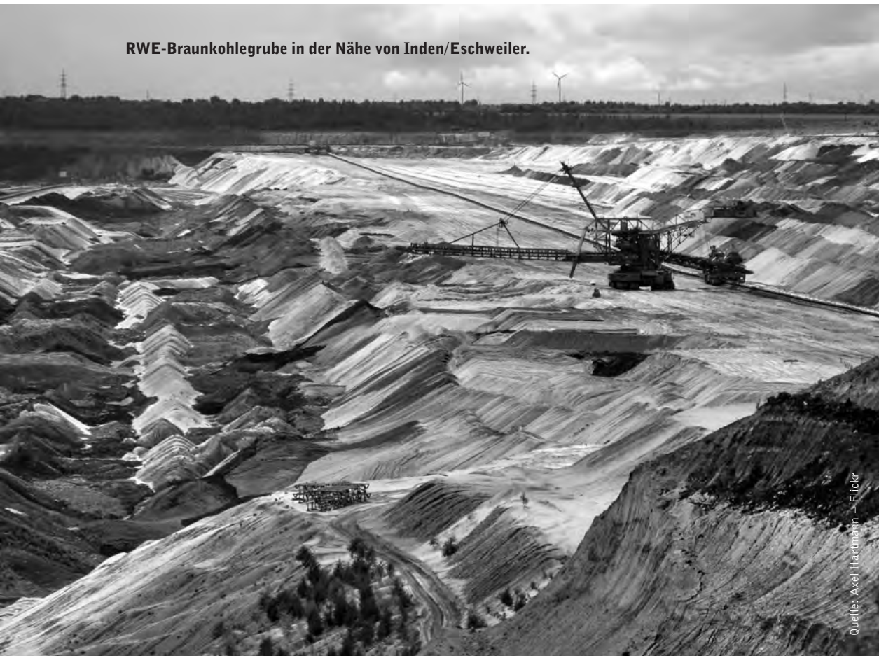
RWE-Braunkohlegrube in der Nähe von Inden/Eschweiler.

Die weltweite Verbreitung des quantitativen Verstandes war in diesem Sinn ein integraler Bestandteil der Ideologie der «Moderne», die die Welt, wie wir sie kennen, formte. Im Lauf der Geschichte führte dieser Prozess weltweit zu tiefgreifenden Veränderungen in der Sprache, mit der wir die materielle Welt um uns herum vermessen und bewerten. Damit ist nicht nur ein Umdenken bezüglich der abstrakten Einheiten gemeint, die wir verwenden – wie das Umrechnen von Zoll in Zentimeter –, sondern ein viel komplexerer Prozess der Internalisierung neuer und fremder Parameter. Diese ersetzten kulturell etablierte und präexistente Bezüge sowie die vielen verschiedenen und traditionellen Bemessungsarten, die seit Jahrtausenden Teil jedes lokalen Wertesystems waren. Epistemizid ist ein hoher Preis, den es zu bezahlen gilt, wenn man alles unter der Sonne in CO 2 -Äquivalenten bepreisen will.