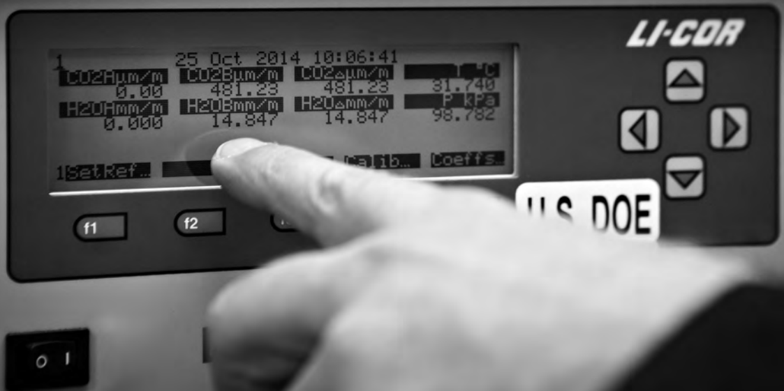
Kontrolle der Daten des Messsystems auf dem Ameriflux-Turm.

Es gibt Akteur/innen und ökonomische Interessen, die von dieser Denkweise profitieren. Im Fall der Kalorien sind es die großen Nahrungsmittel- und